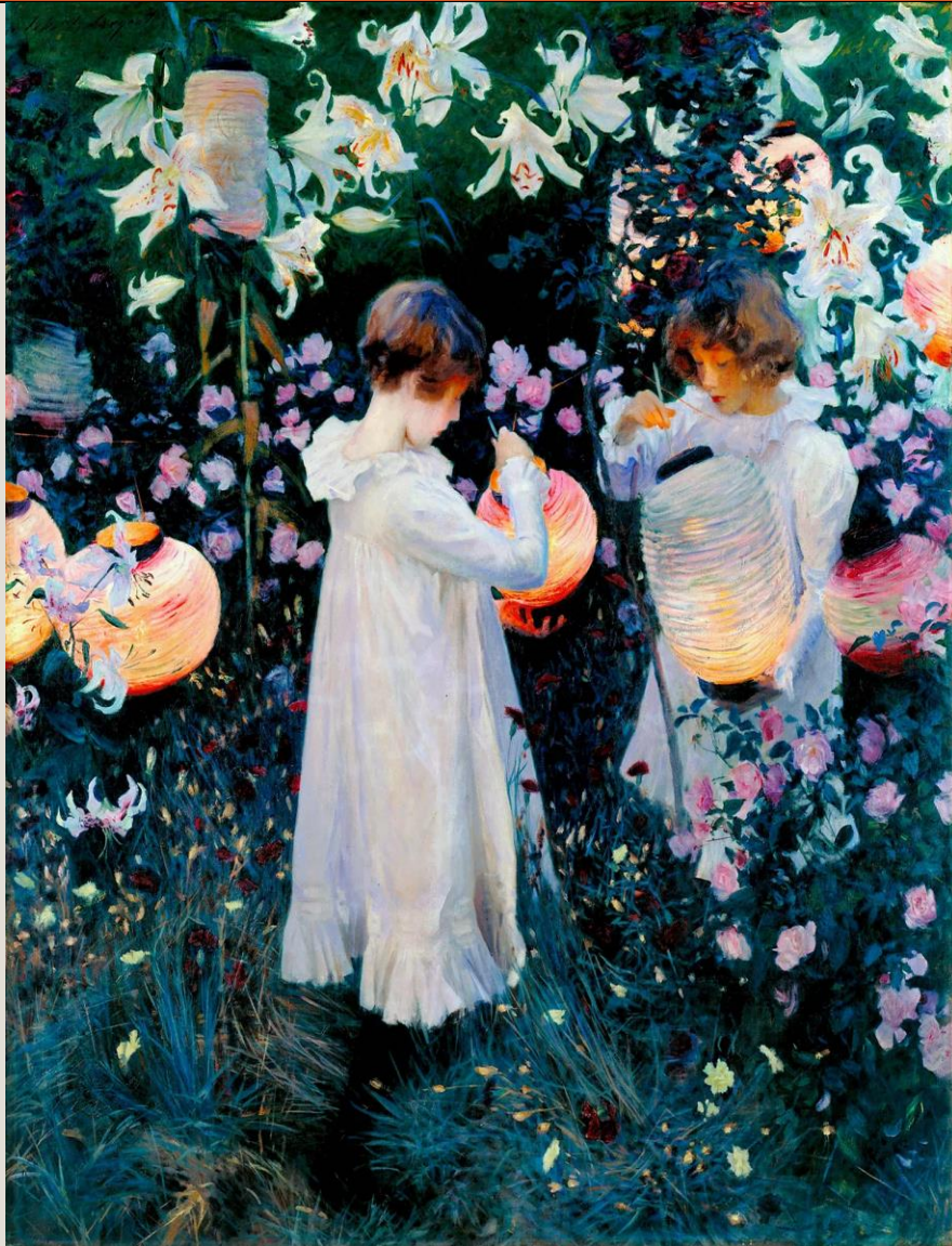
Clavel, lirio, lirio, rosa. 1885. John Singer Sargent.

Estudiaremos a los impresionistas que desarrollaron sus obras por fuera de Francia. Identificaremos aspectos relevantes en el desarrollo del impresionismo en otras regiones y países, pero también las temáticas que incluyeron aspectos sociales relevantes de la época como la moda, la vida en sociedad, los paisajes e incluso la incursión en la pintura por parte de mujeres impresionistas. Serán protagonistas artistas como: Anders Zorn (1860-1920) y Peder Severin Krøyer (1851-1909), Mary Cassatt (1845-1926) y John Singer Sargent (1856-1925).