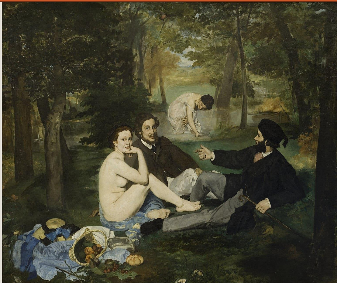
Almuerzo sobre la hierba. 1863. Manet.

Nos acercaremos al Realismo a partir de la literatura y el arte. En este espacio abordaremos a Charles Baudelaire y “El pintor de la vida moderna” como una forma de mezclar las transiciones sociales, las construcciones literarias y las pinturas de Millet y Manet que comparten esa misma narrativa. Aquí podremos ver esas pinturas que reflejan el inicio de la vida moderna donde la representación de la ciudad y la vida cotidiana comenzaron a hacerse más frecuente. Los cambios políticos que precedieron el periodo impresionista se vieron reflejados en las pinturas de la sociedad burguesa.