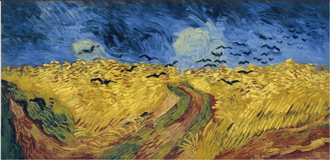
Trigal con cuervos. 1890. Vincent Van Gogh.

Apreciaremos la pintura que mejor refleja la sociedad Burguesa europea: el post impresionismo. Las obras de los post impresionistas hacen parte de un mundo de expresión a través del color que no solo refleja los paisajes y la vida en sociedad, sino también una reflexión alrededor de las emociones y las relaciones entre los mismos artistas que permearon la producción pictórica. Aquí, los protagonistas serán Paul Cézanne (1839-1906), Georges Seurat (1859-1891), Paul Gauguin (1848-1903) y Vincent van Gogh (1853-1890). Estas sesiones estarán acompañadas de experiencias literarias como las Cartas a Theo del artista Vincent Van Gogh, para comprender la mirada propia del artista del mundo que le rodeaba.