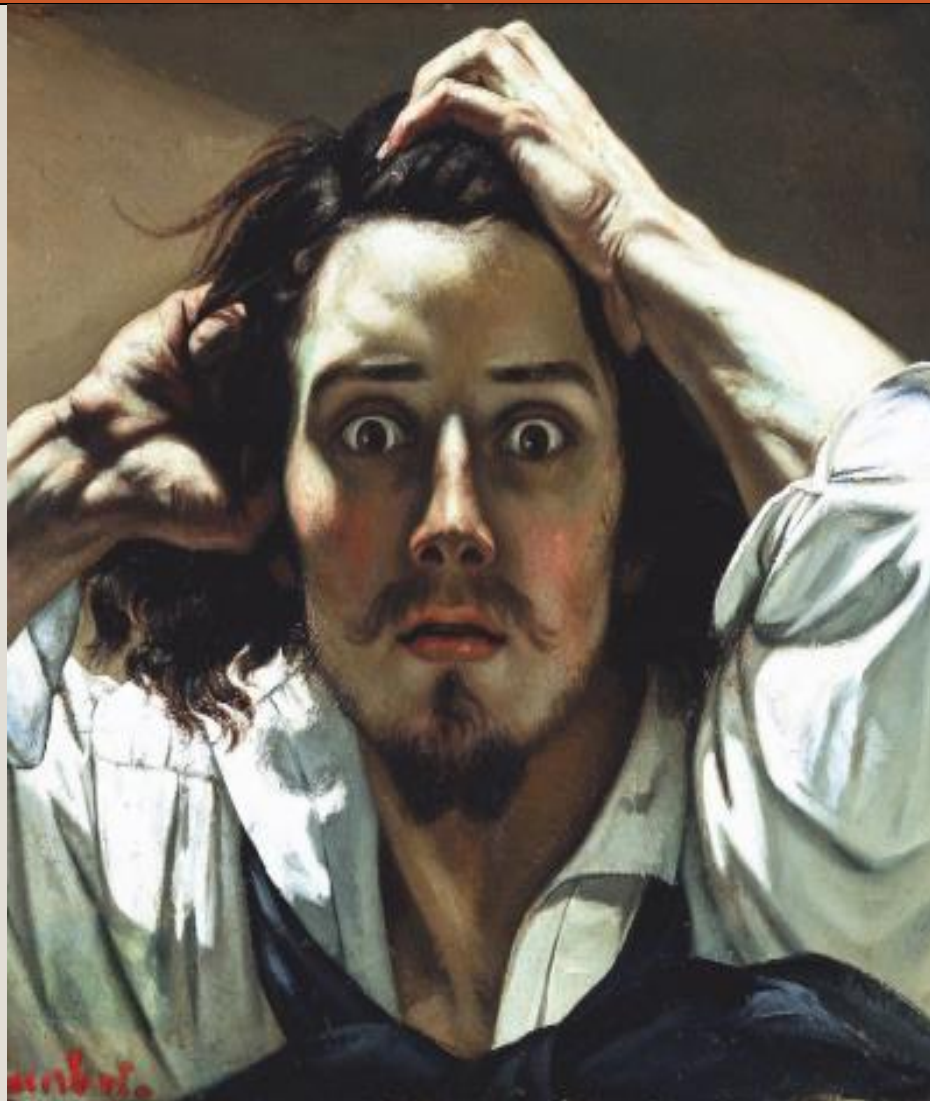
El desesperado. 1845. Gustave Courbet.

Analizaremos los cambios que propiciaron los artistas Gustave Courbet, Claude Monet, y Édouard Manet. Esta es la puerta de entrada al impresionismo y permitirá entender las discusiones sobre el arte que transforman la modernidad. Observaremos los cambios que trajo la industrialización, la materialización de la fotografía y las dinámicas de la sociedad civil sobre la producción artística. Aquí se podrán observar las masas en movimiento y la expresión de la realidad más innombrada a partir de las representaciones pictóricas de personas del común que no están idealizadas. También será un acercamiento a la profundidad psicológica y la soledad del hombre moderno.