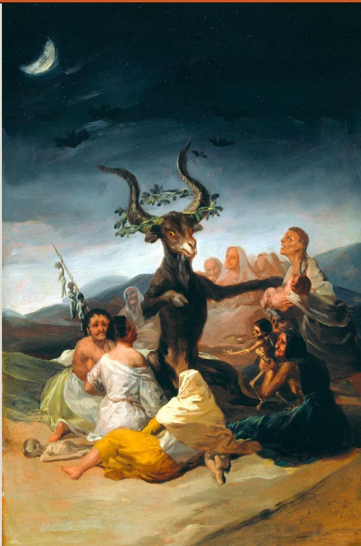
El Aquelarre. 1798. Francisco de Goya.

Rastreademos los antecedentes históricos, políticos y pictóricos que transformaron las miradas del arte desde inicios del siglo XIX. Discutiremos artistas como Füssli, Blake y Goya, considerados como artistas outsiders que no tenían un estilo definido para su época y analizaremos la relación política que tuvo el arte en la Revolución ilustrada en obras de Jacques-Louis David y Eugène Delacroix. Aquí podremos comprender que las revoluciones no fueron solamente políticas, sino que también influyeron en las formas de representación. Asimismo, abordaremos el paisaje como género artístico y antecedente del impresionismo a partir de la obra del acuarelista William Turner. Esta primera sesión mostrará un periodo de transición a la vida moderna a través del arte.