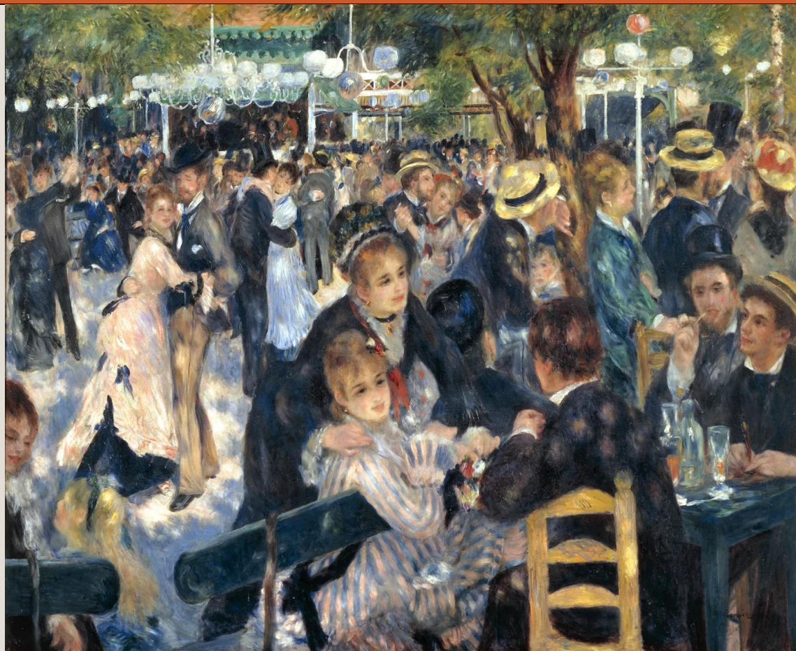
Baile en el Moulin de la Galette. 1876. Renoir.

Realizaremos un análisis inmersivo en el grupo francés de los impresionistas, conociendo sus artistas, sus discusiones y sus tratados como movimientos. Conoceremos las exposiciones independientes que los artistas realizaban despertando la crítica social ante las pinceladas rápidas y la expresividad del color. En esta sección nos acercaremos a artistas franceses como Claude Monet (1840-1926), Pierre-Auguste Renoir (1841-1919), Camille Pissarro (1830-1903), y Edgar Degas (1834-1917).