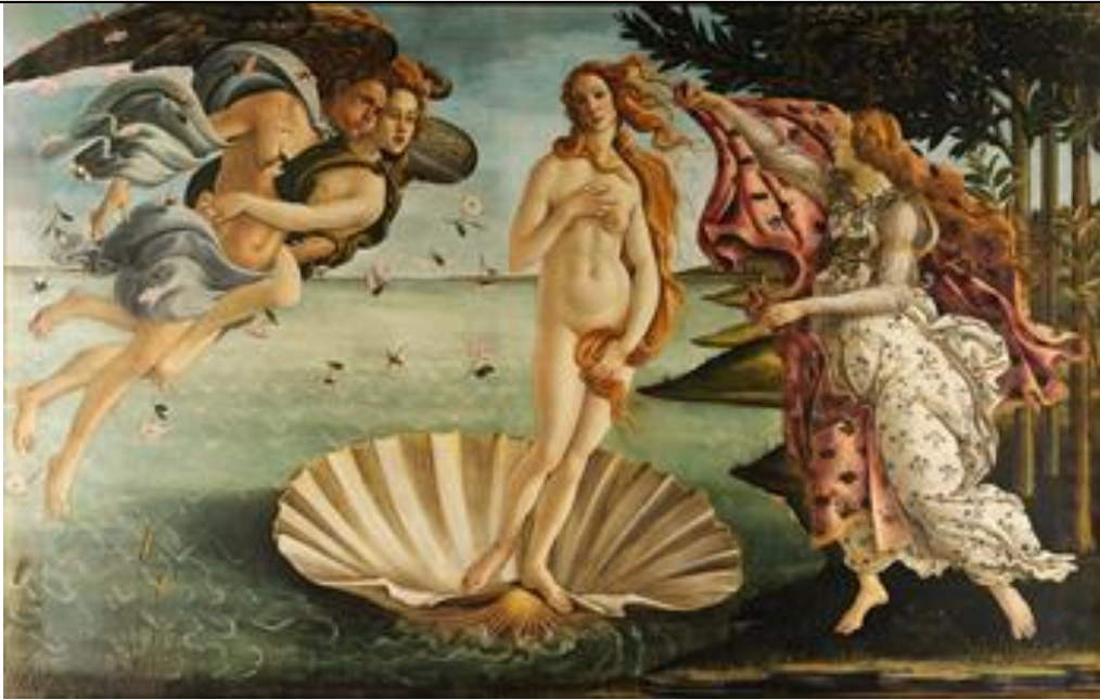
La Venus de Botticelli.