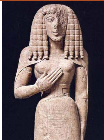
Dama de Auxerre, 700 a.C. Escultura griega, 615-590 a.C.