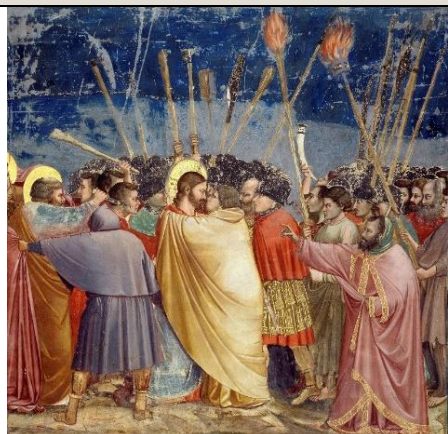
El beso de Judas. Giotto. 1303.