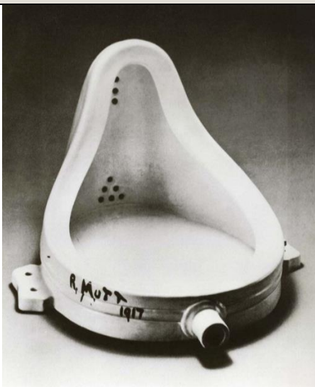
La fuente. Marcel Duchamp. 1917