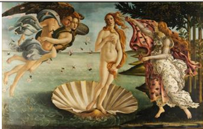
La Venus de Botticelli.