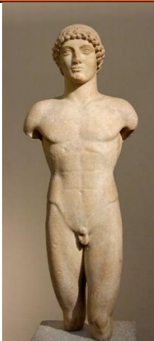
Apolo Tíber, 500 – 490 a.C. Escultura griega