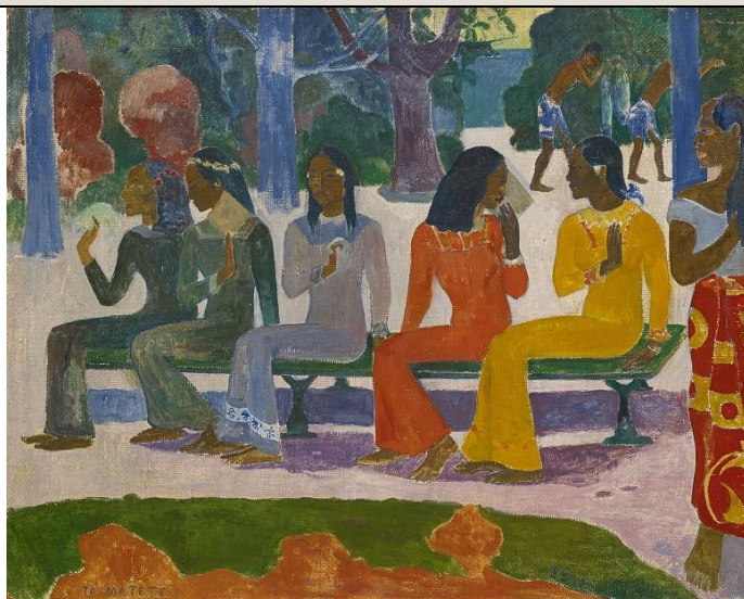
Paul Gauguin: El mercado, 1892